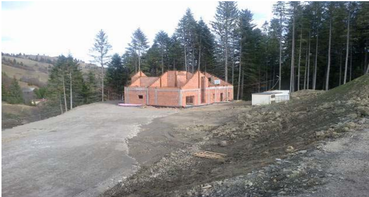
Amenajare clădire administrativă lângă stația de plecare

Acest obiectiv este executat în proporție de 40%, zidăria este executată pentru parter și mansardă. Rămas de executat acoperușul, tâmplăria, instalațiile electrice, termice și sanitare și amenajările interioare.