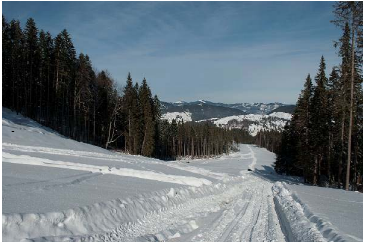
Pârtie schi – tronson 1 (cota 900m, strat de zapadă 70cm)