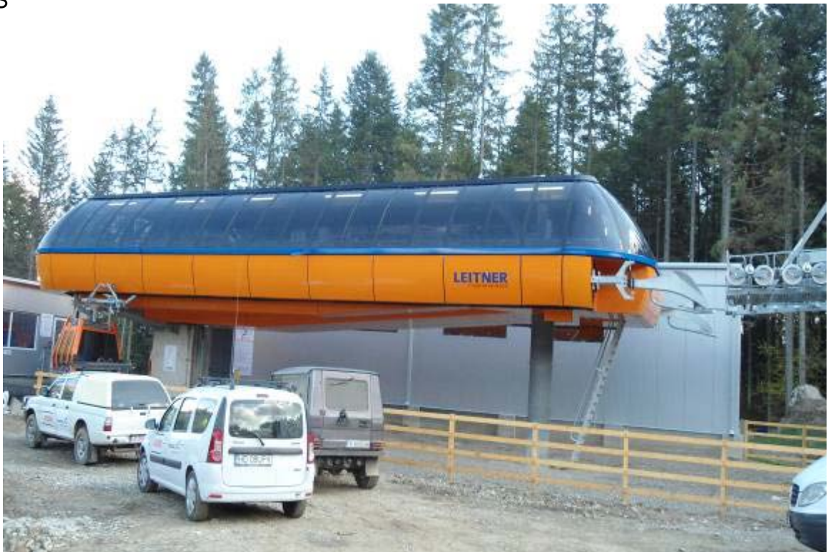
Stație de plecare (tronson 1)