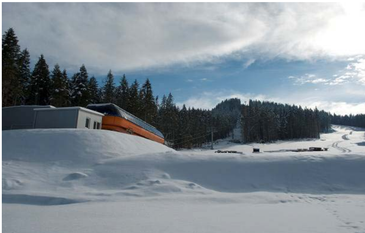
Pârtie de schi – baza pârtiei la cota 765 m (km 5 – DJ 175A)