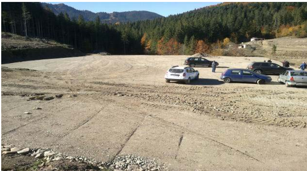
Amenajare parcare lângă stația de plecare

Acest obiectiv se amenajează în zona de sosire la cota 765, s-au executat protecțiile de maluri, podul de acces și lucrările de terasamente în proporție de 70%. Au mai rămas de executat zidurile de sprijin, diferența lucrărilor de terasamente, lucrările de asfaltare și de execuție trotuare.