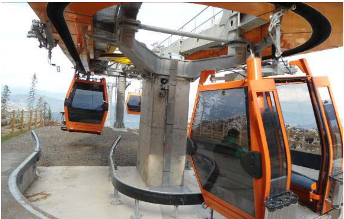
Stație intermediară (tronson 1 – tronson 2)