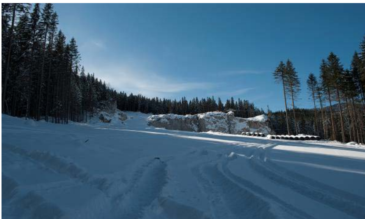
Pârtie schi tronson 1 – plecare de la stația intermediara (cota 1.220m)

Acest obiectiv are o lungime de 2800 m și pleacă de la cota 1220 și sosește la cota 765. Lățimea pârtiei variază de la 30 m în zona de plecare la 80 m în zona de sosire. Panta medie a acestui tronson este de 16,6%, ceea ce o face să se încadreze într-o pârtie de categorie ușoară spre medie. Pârția este profilată în proporție de 80% (a mai rămas zona de plecare și zona de mijloc), sunt executate drenurile de suprafață, a fost executată prima însămânțare, au mai rămas de executat rigolele longitudinale însămânțarea a doua și un podeț tubular.