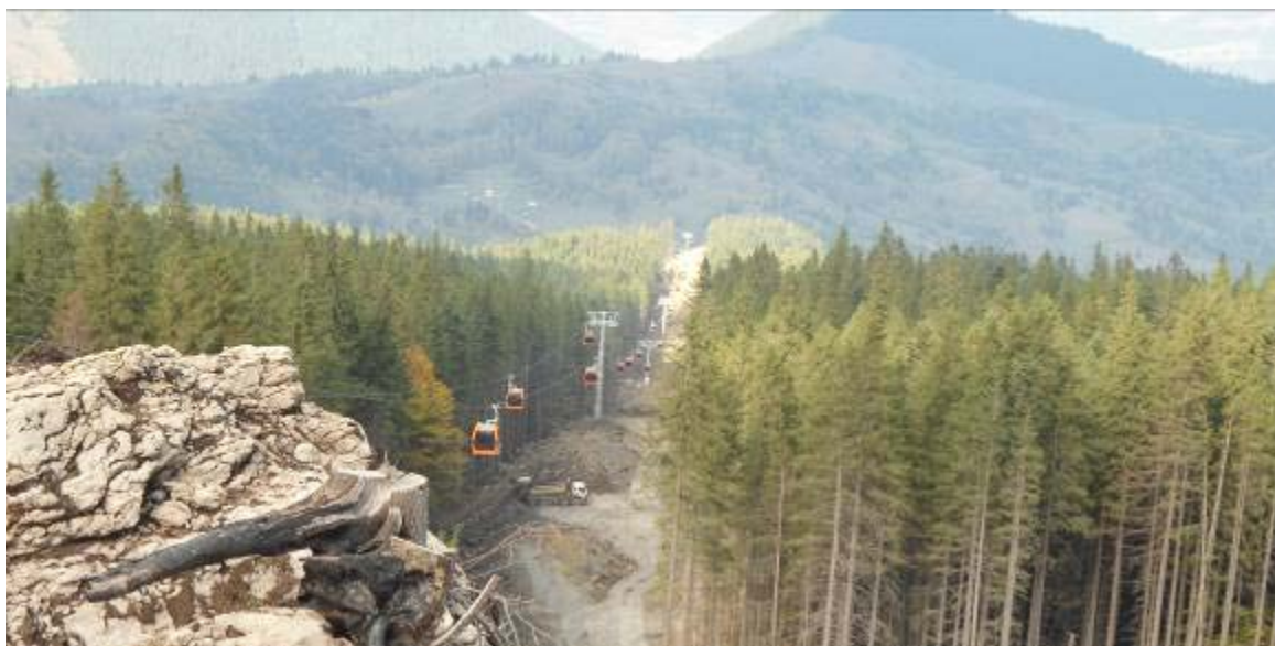
Traseu telegondolă (autorizare ISCIR)