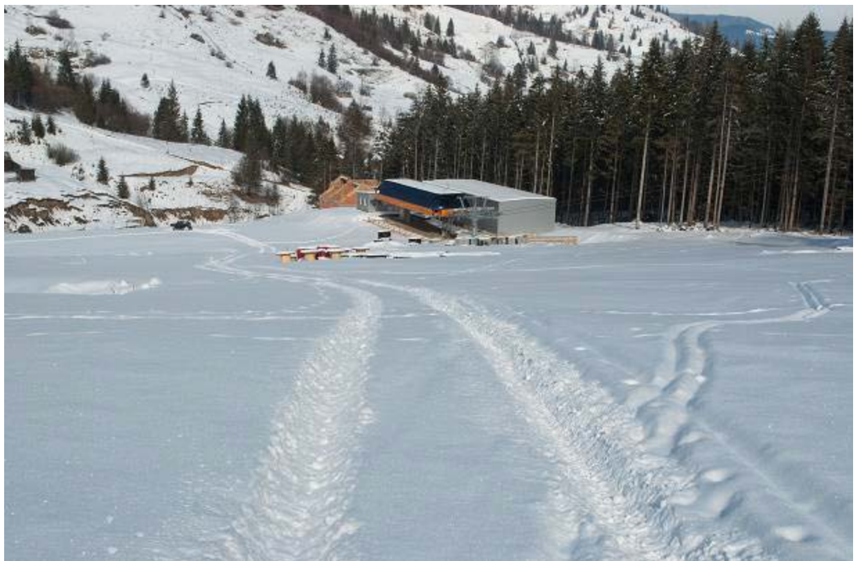
Pârtie schi – tronson 1 (sosire stație de plecare)